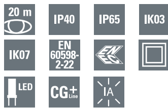
NexiTech LED IA