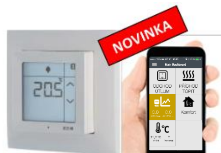
KOMPLET = CPAD-00/198 (187712) Rámeček EATON 55x55 mm, lesklá bílá

Bezdrátový termostat s dotykovým displejem RF systému EATON xComfort je vybavený vnitřním senzorem teploty, vlhkosti a intenzity a časovými plány . Proto je ideálním řešením pro regulaci vytápění a chlazení , příp. jen pro monitorování klimatu v místnosti. Termostat má externí vstup PT1000 pro připojení senzoru CSEZ-01/36 pro měření venkovní teploty nebo regulaci elektrického podlahového vytápění s omezením max. podlahové teploty (při přímém řízení rovněž min. teploty podlahy). Termostat trvale zobrazuje teplotu v místnosti a při doteku rovněž vlhkost, čas nebo venkovní teplotu – ovšem pokud systém venkovní teplotu využívá.