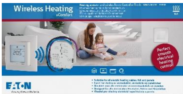
KOMPLET = CPAD-00/217 (193732)

Nejčastěji se instaluje nalepením na stěnu bez nutnosti použití instalační krabice. Pokud bude ale využito externí napájení nebo připojení externího senzoru PT1000, je zapotřebí instalační krabice o průměru 68 mm. Standardně je termostat napájen dvěma bateriemi AAA, které jsou součástí balení. Výhodou je rovněž možnost externího napájení z centrálního zdroje CMMZ-00/13. Vestavěný USB konektor slouží pro softwarový update anebo rovněž pro napájení. Termostat je vyráběn v šesti barvách středových krytů - lesklá bílá, zářivě bílá, alpská bílá, signální bílá, matná antracitová a černá. Přístroj není závislý na konkrétním výrobci rámečku, barvě či materiálu - s výhodou je možné vybrat z mnoha doporučených výrobců rámečků se středovým otvorem 55x55 mm.