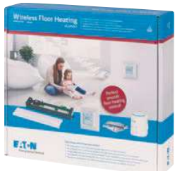
RF Sada pro vodní podlahové vytápění pro 5 místností CPAD-00/220