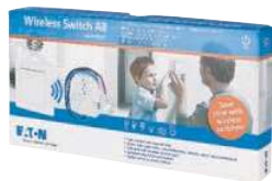
RF Spínací sada CPAD-00/212