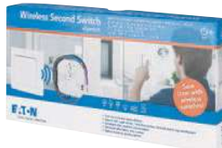
RF Spínací sada modernizace CPAD-00/215