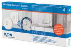
RF Spínací sada s pohybovým senzorem CPAD-00/230