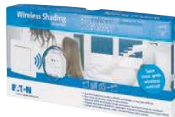
RF Roletová sada CPAD-00/214