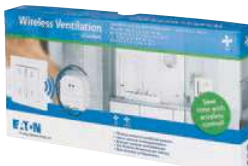
RF Ventilací sada CPAD-00/216