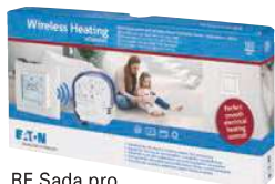
RF Sada pro vytápění CPAD-00/217