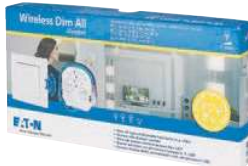
RF Stmivací sada CPAD-00/213