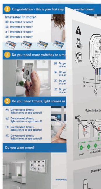
Přehledová karta pro uživatele