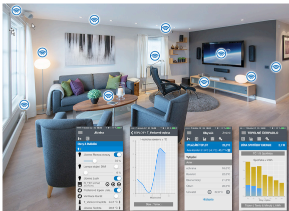
Obr. 5 Vyhodnocení spotřeby všech energií přehledně v grafu