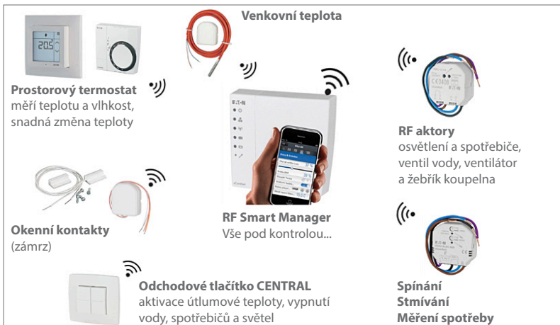
Obr. 4 Řízené ovládání přes internet