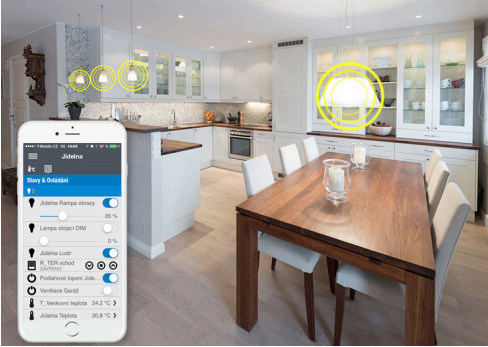
Obr. 2 Moderní způsob ovládání osvětlení pomocí přednastavených scén