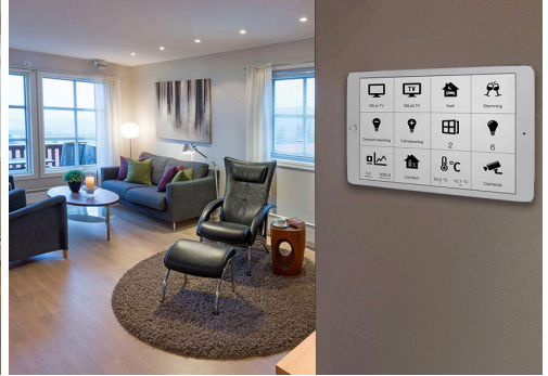
Obr. 3 Vše pod kontrolou i na tabletu

Bezdrátová instalace xComfort totiž nevyžaduje žádné speciální rozvody ani velký rozváděč, jako sběrnice. Lze začít v malém s jednoduchými a praktickými funkcemi a později ji dle potřeby rozšířit. Aktory lze instalovat také přímo do svítidel nebo ke spotřebičům. Hlavice pro radiátory, prostorové termostaty a nástěnná tlačítka se používají bezdrátově a jsou napájené baterií, přičemž baterie ve vypínači se mění jednou za deset let. Ovládání aktorů je možné také běžnými vypínači 230 V, které se zapojí na ovládací vstup aktoru. Tím se instalace velmi zlevní. Spotřeba kabelů je ještě menší, než u klasické instalace.