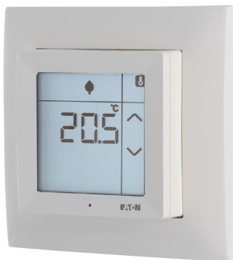
Obr. 8 Nový RF pokojový termostat s dotykovým displejem

Nejčastěji se instaluje nalepením na stěnu bez nutnosti použití instalační krabice. Pokud ale bude využito externí napájení přístroje nebo připojení externího senzoru teploty, instaluje se krabice KU68. Standardně je termostat napájen 2x baterií typu AAA, použít lze rovněž napájecí zdroj. Termostat je vyráběn ve čtyřech základních