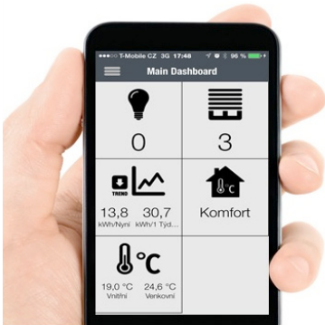
Obr. 9 Pohodlné ovládání kdekoli na cestě

Pokud chcete udělat první krok k chytrému bydlení, máme pro vás několik možností. Instalaci začněte s přednastaveným balíčkem. Dle požadavku zákazníka si objednejte nejvhodnější startovací sadu pro ovládání osvětlení a spotřebičů (SMART OVL), ovládání rolet a žaluzií (SMART ROL), regulaci vytápění domu či chaty (SMART TOP) a zónové řízení radiátorů (SMART RAD).