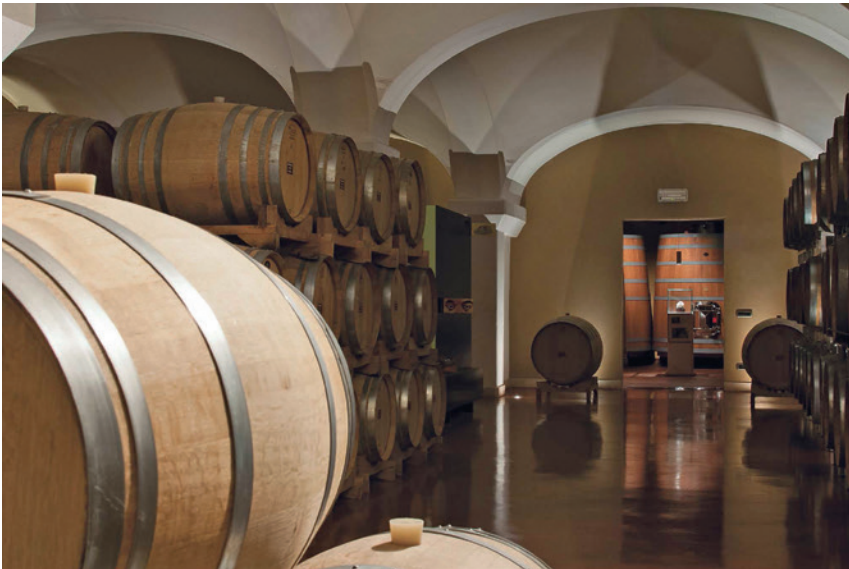
Die Beco Protect PP Pure™-Tiefenfilterkerzen von Eaton helfen dem Unternehmen, seine „hohe Qualität – von der Traube bis zum Glas“ zu erhalten – bei gleichzeitiger Steigerung von Effizienz und Produktivität.