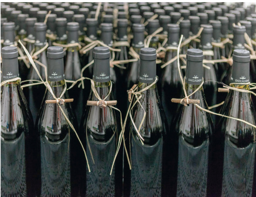
Die kürzlich installierte Filterkerzenlösung Beco Protect PP Pure™ von Eaton in der Produktionsanlage von Zaccagnini hat bereits mehr als 2,83 Millionen Liter Wein erfolgreich filtriert.

Filterkerzen verblockten frühzeitig. Daher mussten sie häufig regeneriert werden, was wiederum ihre Standzeit reduzierte. Darüber hinaus erforderten die Filtermatrix und das Filtermaterial der Kerzen besonders langwierige und komplexe Spülvorgänge, was die Produktivität weiter verringerte. Um diese Probleme zu lösen, wandte Zaccagnini sich an Eaton, um sich von den Experten beraten zu lassen.