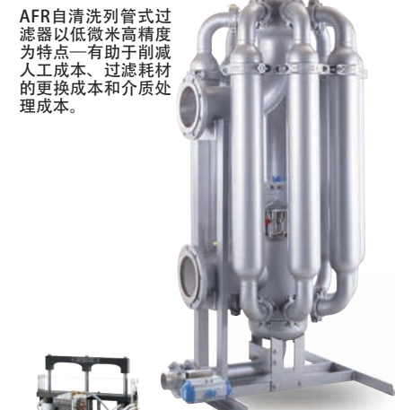
AFR自清洗列管式过滤器以微米高精度为特点—有助于削减人工成本、过滤耗材的更换成本和介质处理成本。

伊顿的单管、双管和列管式反冲洗过滤器无耗材，采用先进在线清洗技术，维护简单，操作成本低，为客户从水中自动去除杂质提供了一个可持续的解决方案。