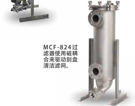
MCF-824过滤器使用磁耦合驱动刮盘清洗滤网。

伊顿MCF-824系列机械自清洗过滤器使用伊顿的磁耦合驱动技术驱动清洗刮盘，无需使用轴或外部密封件。这种技术不仅简化了操作，缩短了维护停机时间，还最大程度地减少了耗材更换需求及相关产品损耗和废弃耗材处理。