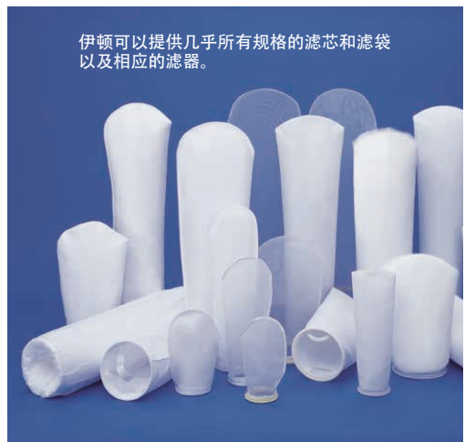
伊顿可以提供几乎所有规格的滤芯和滤袋以及相应的过滤器。

伊顿的标准铸造单筒、双筒和Y型管道过滤器可使用铸铁、碳钢、不锈钢和青铜铸造。定制焊接设计可满足几乎所有的过滤精度与流量、特殊合金、特殊管道连接或特殊尺寸的要求。管道过滤器符合ISO 9001:2008质量管理体系。