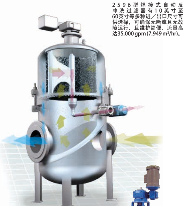
2596型焊接式自动反冲洗过滤器有10英寸至60英寸等多种进/出口尺寸可供选择，可确保无断流且无故障运行，且维护简便，流量高达35,000 gpm (7,949 m³/hr)。

伊顿2596型自动反冲洗过滤器将紧凑型模块化设计与自动冲洗系统完美结合，为用户提供简单、低维护和具有环保责任感的解决方案，从而实现了低能耗、无耗材和零污染排放等几大优势。