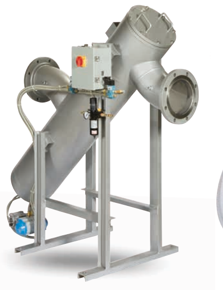
MCS-1500过滤器是满足大流量过滤需求的最佳选择。它采用磁耦合驱动技术来减少动密封件的损耗。

伊顿MCS-500和MCS-1500过滤网采用独一无二的磁耦合驱动技术，消除了对动密封的依赖。这种技术为淡水应用提供一个有效、环保和低排污的解决方案，从而最大限度地降低了维护停机时间和操作成本。