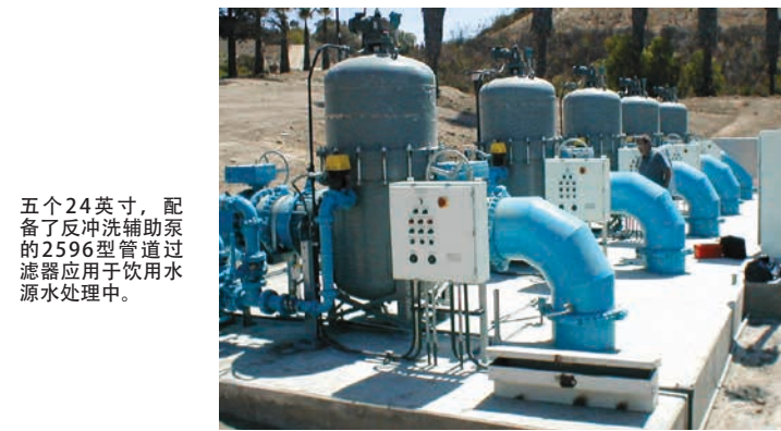
五个24英寸，配备了反冲洗辅助泵的2596型管道过滤器应用于饮用水源水处理中。