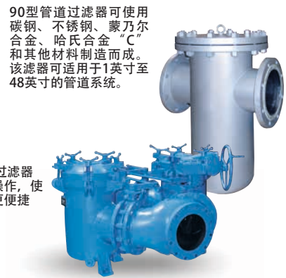
52型管道过滤器同步阀门操作，使滤芯更换更便捷。

90型管道过滤器可使用碳钢、不锈钢、蒙乃尔合金、哈氏合金“C”和其他材料制造而成。该过滤器适用于1英寸至48英寸的管道系统。