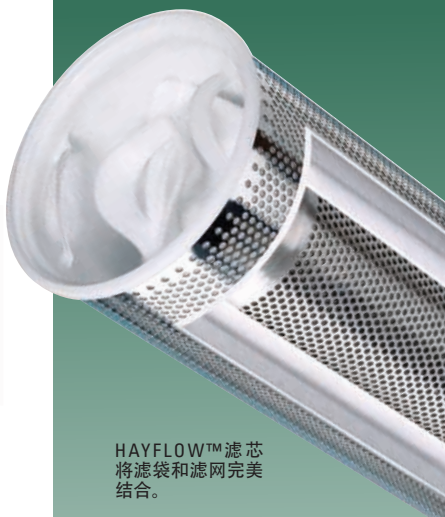
HAYFLOW™ 滤芯将滤袋和滤网完美结合。

伊顿称精度和绝对精度的深层过滤滤芯和折叠膜滤芯安装在伊顿不锈钢和塑料滤芯式过滤器里，在大量的应用中体现了优异性能。