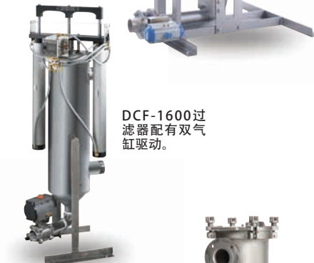
DCF-1600过滤器配有双气缸驱动。

伊顿的DCF系列机械自清洗过滤器结构简单，前期成本低，产品设计压降低，减少能量损耗。