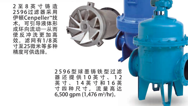
2596型球墨铸铁型过滤器还提供10英寸、12英寸、14英寸和16英寸四种尺寸，流量高达6,500 gpm (1,476 m³/hr)。