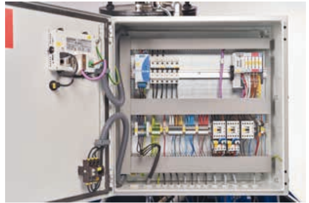
Internetfähige Steuerungseinheit mit Touch-Panel und USB-Schnittstelle