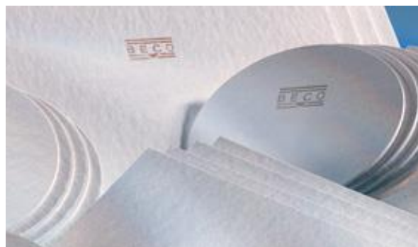
Portata d'acqua BECO serie standard

Strati filtranti di profondità BECO per raggiungere un elevato grado di chiarifica. Questi tipi di strati ritengono le particelle più fini in modo sicuro ed hanno un effetto di ritenzione microbiologica. Per questo motivo sono particolarmente adatti per la conservazione e l'imbottigliamento di liquidi limpidi.