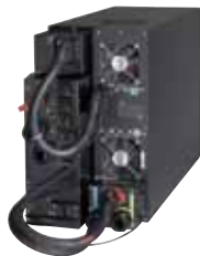
ИБП 9PX 11kVA с сервисным байпасом