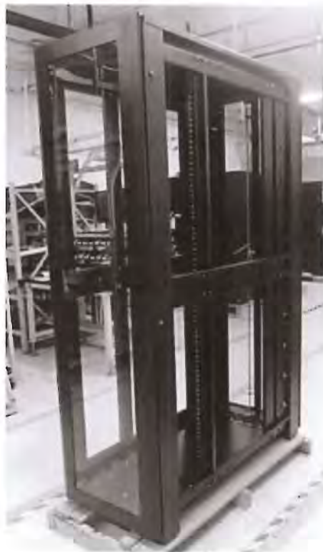
图 2 静载荷测试前