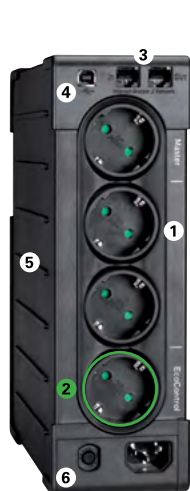
Eaton Ellipse PRO 650

6 Przycisk resetowania wyłącznika zabezpieczającego