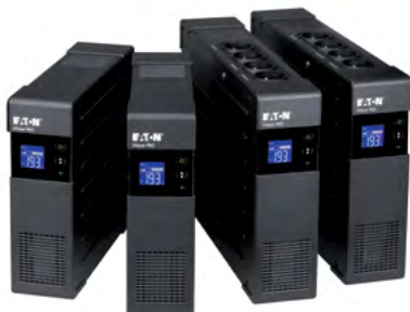
Grupa produktów Ellipse PRO