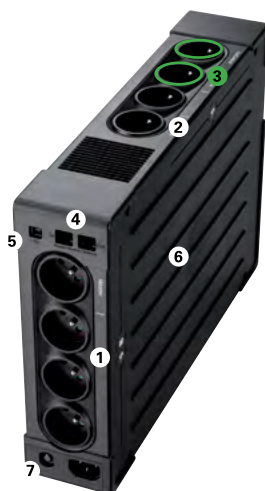
Eaton Ellipse PRO 1600

1 4 gniazda wyjściowe z ochroną przeciwprzepięciową i podtrzymaniem bateryjnym