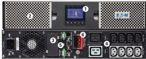
Eaton 9PX 3000VA