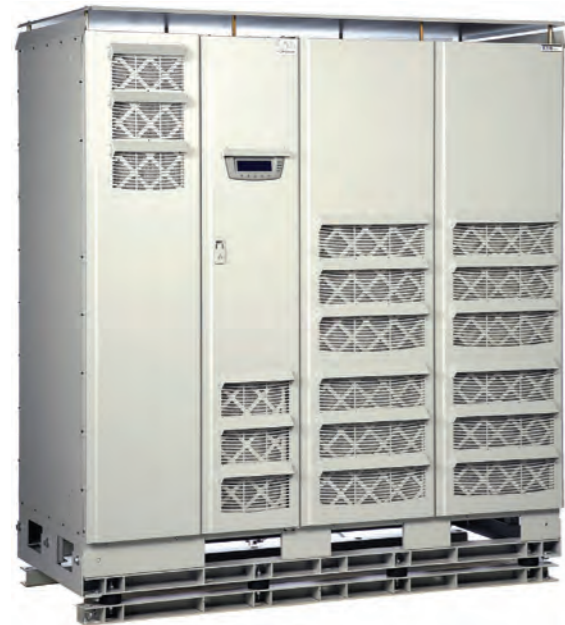
伊顿 9395M 225-1100kVA