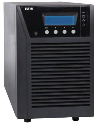
伊顿 9130 船用 UPS 1-3kVA

用于保护船舶或海上平台: • 船桥系统 • 导航系统等 • 通讯系统 • 小型计算机系统及自动化控制系统