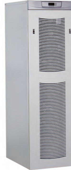
伊顿 9155M 8-30kVA 伊顿 9355M 8-40kVA

用于保护船舶或海上平台: • 应急照明系统 • 紧急公共广播系统 • 计算机及通讯系统 • 船舶自动化控制系统