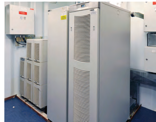
在“海洋绿洲号”上，伊顿船用型 UPS 为关键应用负载提供安全电力保护，使其免受断电影响

每一种型号的伊顿船用型 UPS 都是针对于船舶的实际应用环境经过严谨的设计、谨慎而又全面的测试才诞生的，如系统减震、防水盖板、漏水检测保护等。还有它们都使用了与我们标准型 UPS 相同的伊顿全球的技术平台和核心部件，是的我们可以使用通用的维修备件和附件，同样的方式进行系统升级、维护和服务，以确保特殊的船用型 UPS 与标准的通用型 UPS 一样安全、可靠、长寿命。