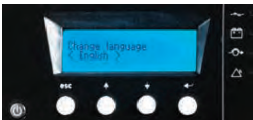
多语言 LCD 显示器