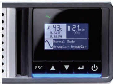
直覺化 LCD 顯示器，方便 配置和管理