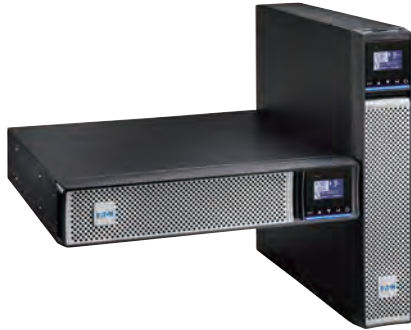
機架式/直立式多用途