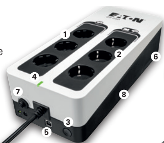
Eaton 3S 550 DIN