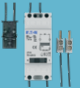
Beltrafo FLEX type TR-G-8-S-FL 1740298

(Beltrafo wordt zowel in 1-fase als 3-fasen configuraties toegepast)