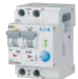
AFDD+ FEHLERLICHTBOGEN- SCHUTZSCHALTER Inklusive FI/LS

Fehlerlichtbogenschutz (seriell und parallel)