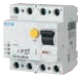
FI Fehlerstromschutzschalter FI