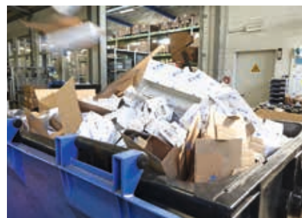
Gli imballaggi riutilizzabili eliminano rifiuti inutili.