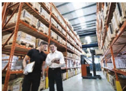
Agevoliamo l'intero flusso di produzione.