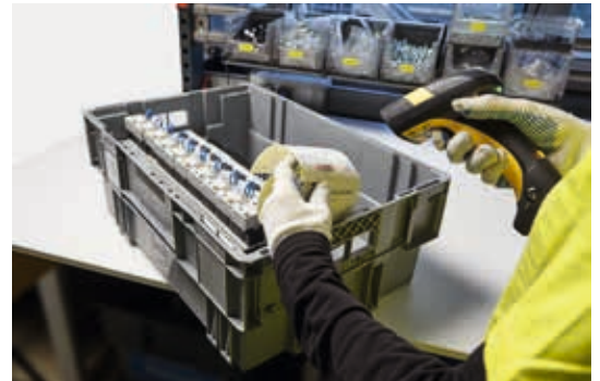
Gestione rapida grazie all'utilizzo di etichette personalizzate.