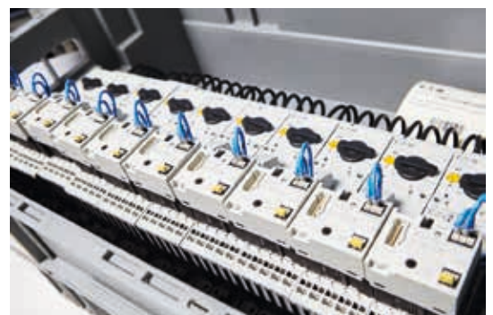
Le combinazioni di prodotti pre-cablati riducono il lavoro di installazione.