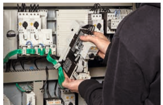
Risparmi tempo con le combinazioni pronte per l'installazione.

Il team VAS di Eaton può fornire una valutazione attenta dei tuoi processi e del tuo flusso di lavoro. Valutiamo con attenzione le tue attuali operazioni e ti offriamo indicazioni per poterle ottimizzare, aiutandoti a garantire che i tuoi processi aggiungano valore giorno per giorno.