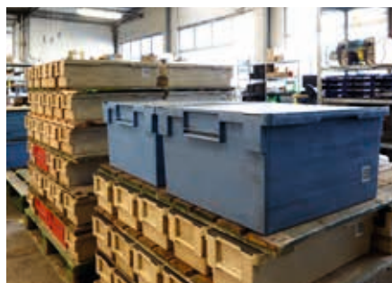
Il nostro gruppo VAS ti aiuta a snellire i tuoi processi logistici.

Dalla prima analisi dei processi alla consegna della soluzione più adatta a te: Eaton e il suo gruppo VAS possono offrire tutto con unico fornitore!